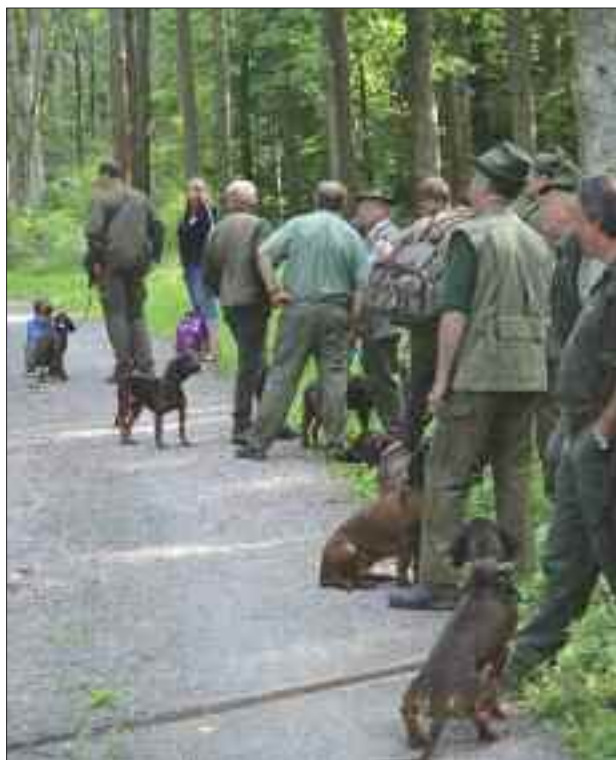
výcvikový den 24.8.