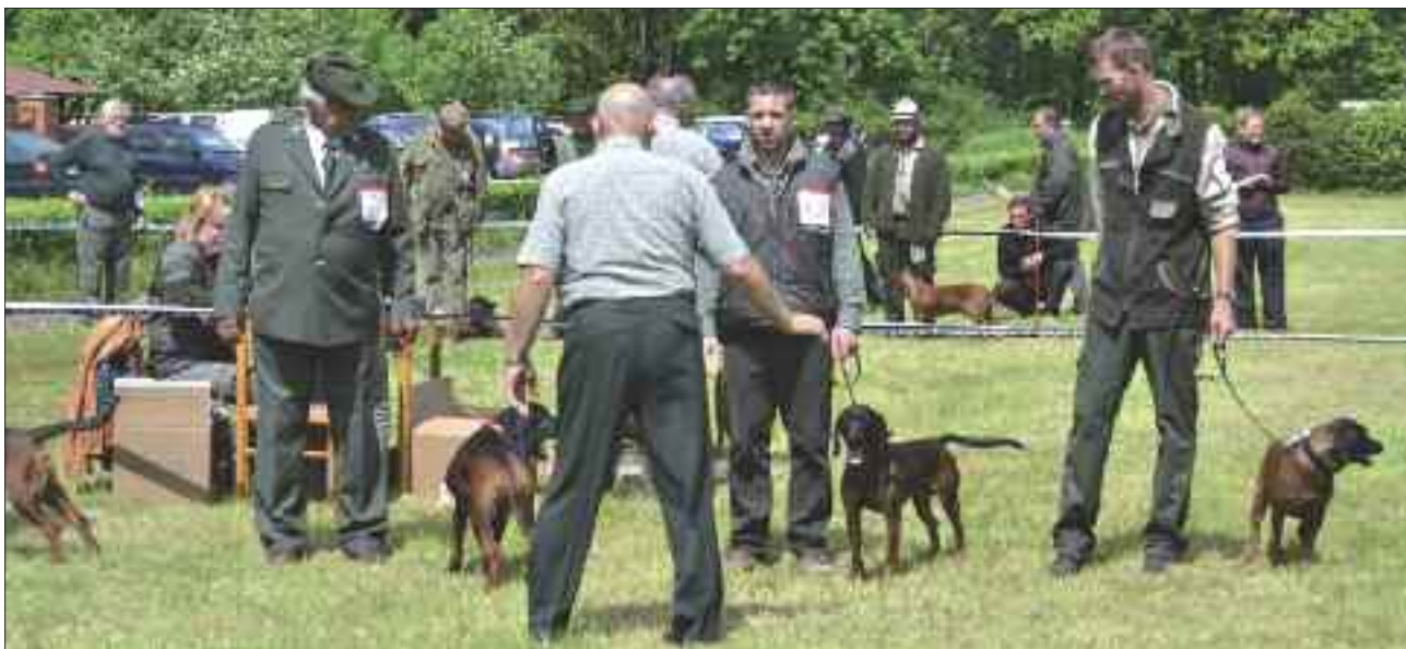
Posuzování v kruhu