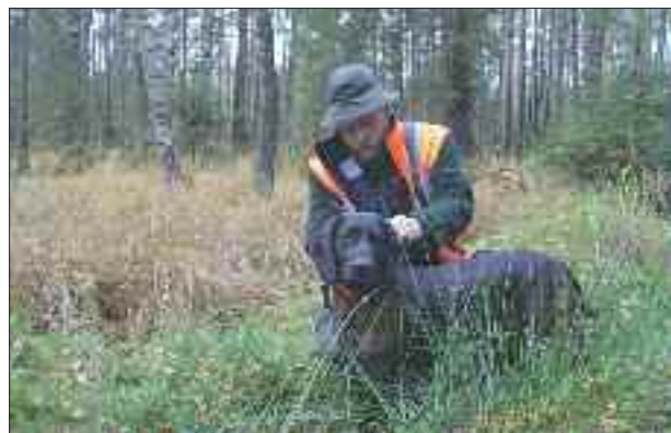
Nástup na práci

Hned první večer jsme zjistili, že jsme všichni podcenili přípravu na polskou pohostinnost. Každý z vůdců zaměřil svou pozornost pouze na přípravu svého soutěžního psa, ale z hlediska vlastního apetitu jsme byli nachystáni zcela nedostatečně. Nikdo nás neupozornil na nutnost týdenní hladovky. Sníst celé kilové uzené koleno s pečivem, knedlíkem a zeleninovou přílohou zvládli pouze borci z Polska. Tento trend maxiporcí o třech chodech trval po celou dobu soutěže. Musím zdůraznit rovněž přátelskou atmosféru celé soutěže, kdy se pořadatelé snažili co nejobjektivněji přidělovat práce bez ohledu národnosti a úmyslně nikdo nikoho nechtěl poškodit. Systém soutěže vychází z přírodních postřelů. V okolí města Opole byly po tři dny pořádány společné lovecké akce, na kterých lovilo téměř 300 střelců. Pokud někdo z lovců našel znaky postřelu (barva, stříž, atd...), označil nástřel a nahlásil tuto skutečnost svému závodčímu a ten řediteli soutěže. Práce byly přidělovány v časovém pořadí takovém, jaké jsme si vylosovali na slavnostním nástupu. V tomto ohledu jsem vůbec neměl štěstí a vylosoval si číslo 8. Tedy poslední. Z pátečního večera byly již čtyři postřely, ze sobotního rána dva. Prvních šest soutěžících se rozjelo na své práce, a my dva poslední