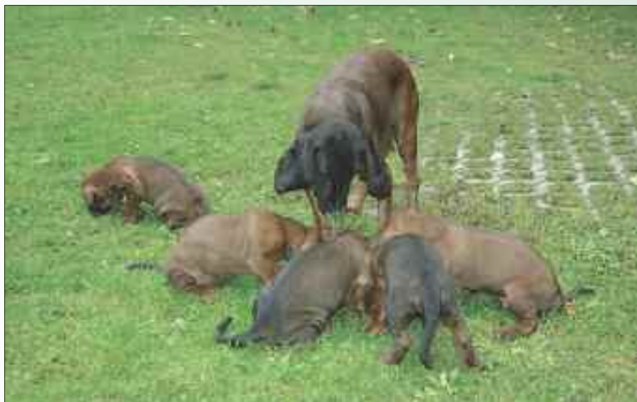
Zdravá štěňata jsou cílem každého chovatele

V roce 2013 se nám u jednoho jedince BB a jednoho HB vyskytla epilepsie a výbor na své první schůzi k tomuto přijme jisté opatření.