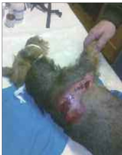
Snímek postiženého psa na Znojemsku MVDr. Jan Dočekal