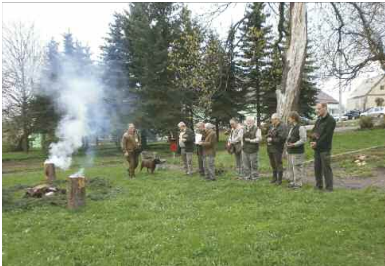
Krušnohorské derby - sbor rozhodčích

Soutěžilo se v následujících disciplínách: dosled, šoulačka s odložením, způsob oznamování, chování u kusu, chuť do práce. Velká pozornost byla věnována hlavní disciplíně dosled – stopa, která byla položena předešlý den, jejíž stáří bylo nejméně 12 hodin. Při navádění na stopu všichni vůdci předvedli správný postup a tím předpoklad pro dobrou práci barváře, včetně počátečního sledování stopy.