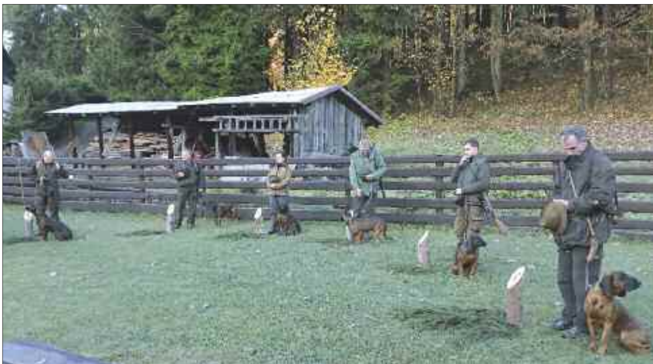
Pb 19. 10. 2013 Zdobnice