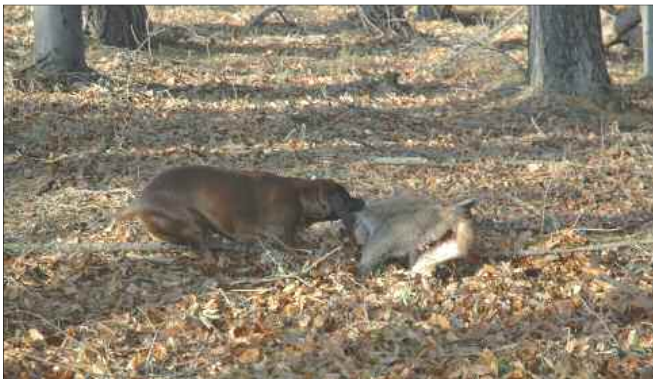
Dobře vycvičený barvář se nebojí zvěře