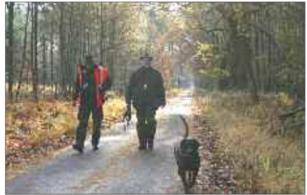
Nic jsme nenašli