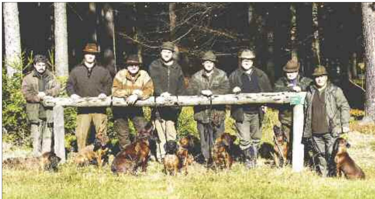
Výcvikový den v Doubici

Jako každý rok jsme opět uspořádali vlastně již tradiční výcvikový den VŘSR v parku. Naš klub má od letošního roku díky iniciativě kluků z parku uzavřenou smlouvu