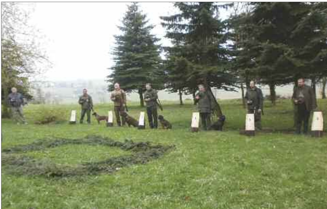
Krušnohorské derby - vůdci při nástupu