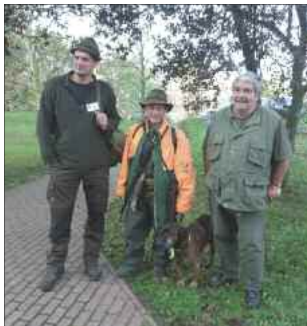
Setkání po letech... dlouhý, bystrozraký, široký