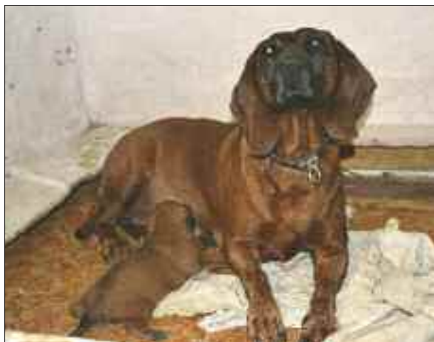
Cíta z Poplužního dvora se štěnětem

Za první- chtěl bych poděkovat majiteli krycího psa. Když jsem mu vylíčil celý příběh porodu a další moje problémy, nechtěl za krytí nabízenou fenečku která přežila, ani peníze za krytí. Poděkování jsem uveřejnil v německém časopise. Takových lidí je již skutečně méně a méně.