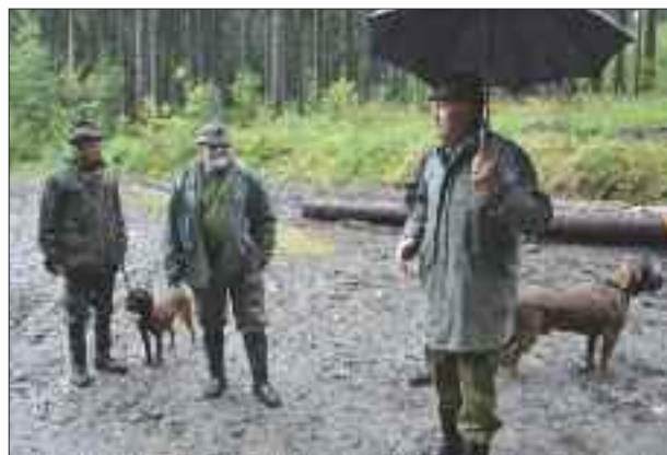
Celý den lilo