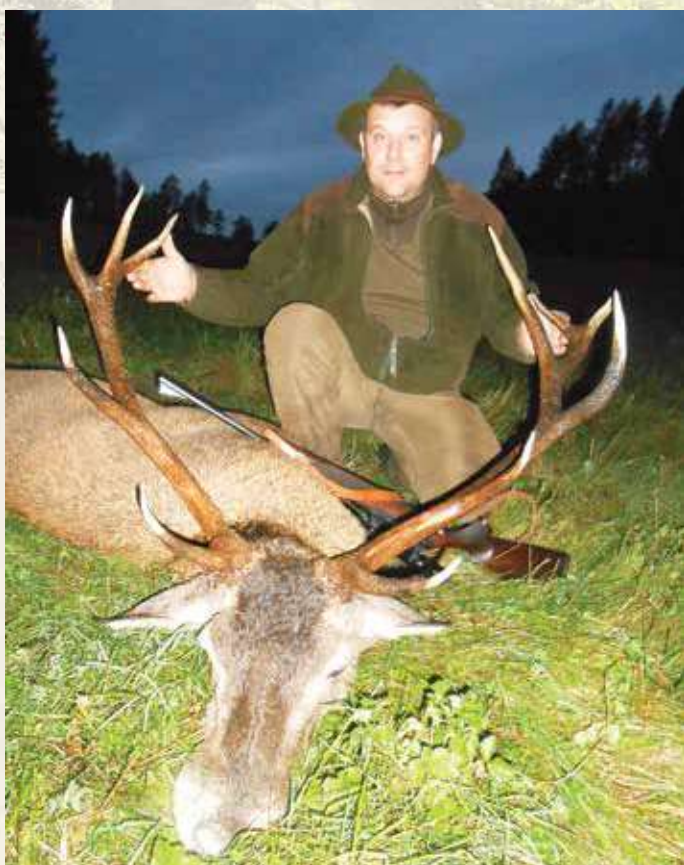
1. cena pro vítěze soutěže Mariána Pavelku.