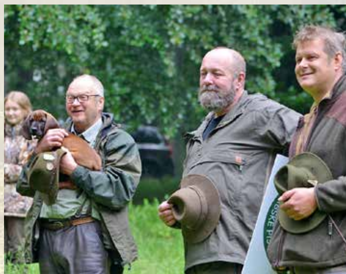
Z Doubické stopy 2020.