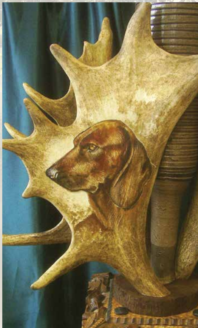
Původní podoba poháru.